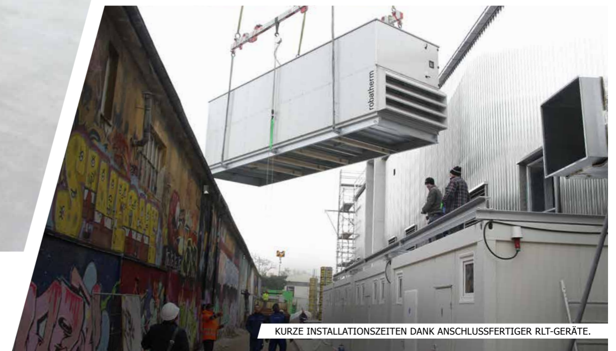
KURZE INSTALLATIONSZEITEN DANK ANSCHLUSSFERTIGER RLT-GERÄTE.

Die gelungene Komposition aller Prozesse schafft Effizienz und die Grundlage für Liefertermine, auf die Sie sich verlassen können.