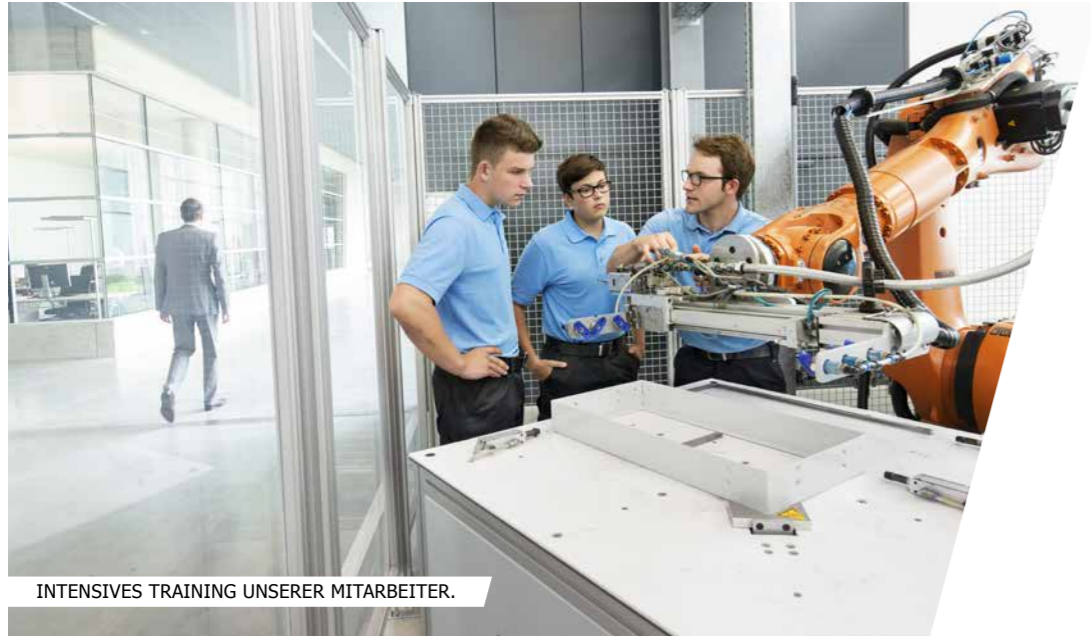
INTENSIVES TRAINING UNSERER MITARBEITER.