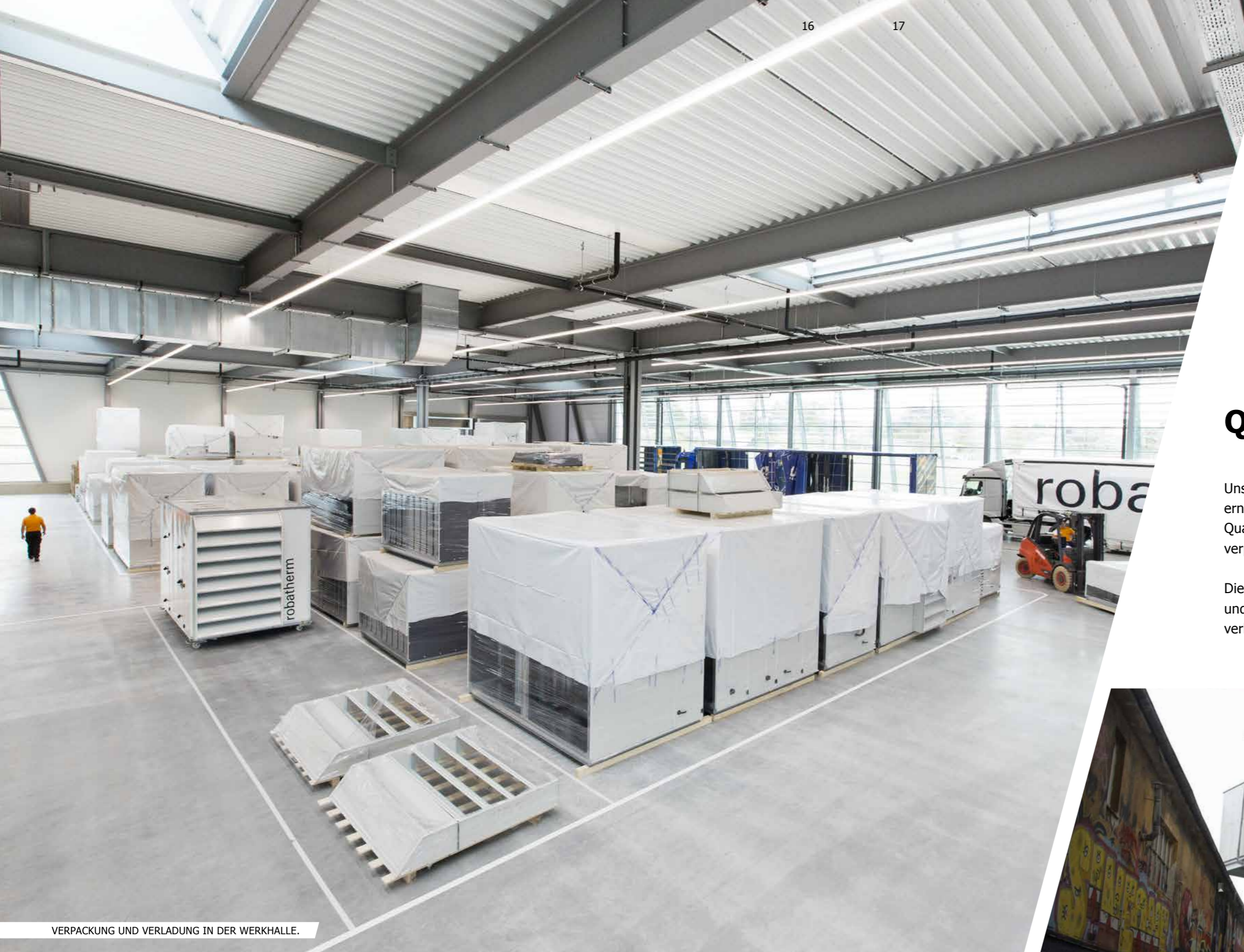
VERPACKUNG UND VERLADUNG IN DER WERKHALLE.